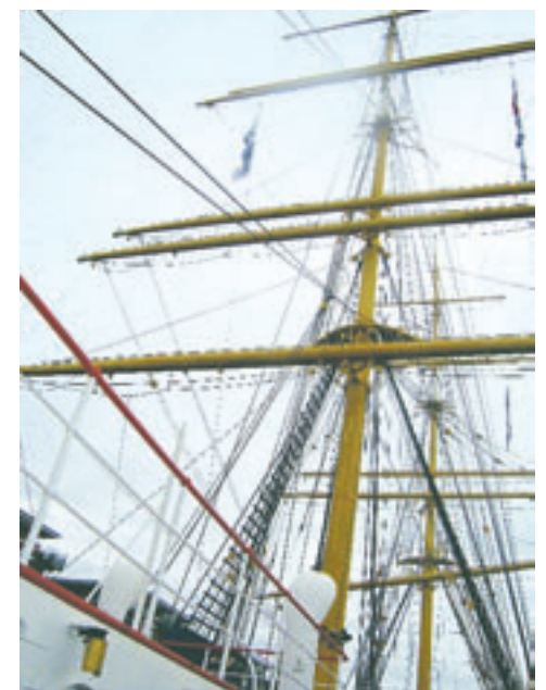
Auf diese hohen Masten mussten die Zöglinge klettern.

Manche jungen Leute würden heute nicht mehr eine Ausbildung auf dem Schulschiff machen, weil es sehr unbequem ist. Aber andere finden, dass so etwas doch