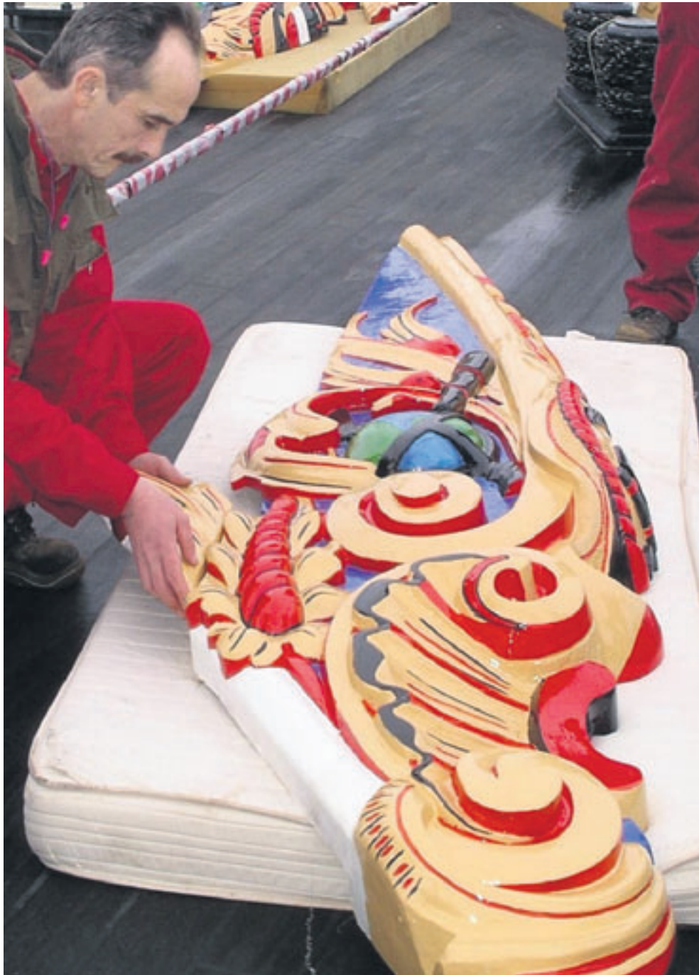
Die neue Bugzier wird vom Künstler selbst geliefert.